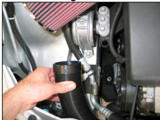
Fig. # 21